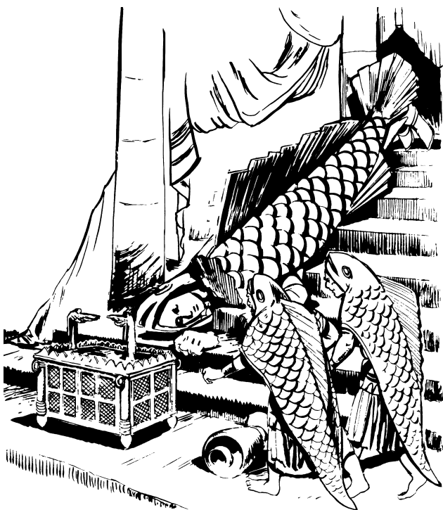
Nedaetan sa inetaw Dagon danà sa Baul Tandà Pasad i Nemula

lapeg sa medoo etaw diyà sa medoo menuwa nekeulingut. Pinetunasan i Nemula kagda sa linadu mebagà anì pigtamayan di kagda. 7 Egoh sa medoo tegeAsdod mighaa sa nebaelan, eg-ikagi da, guwaen da, “Endà mebaluy di mupà diyà kenita sa Baul Tandà Pasad i Nemula, sa Nemula egpigtuuwen sa medoo tegeIslaél, enù ka egpigtamayan di kita i owoy si Dagon sa egpenemulawen ta.” 8 Huenan di, sinetipon da sa langun ulu-ulu tegePilistiya owoy inigsaan da kagda, guwaen da, “Ngadan sa baelan ta diyà sa Baul Tandà Pasad i Nemula sa