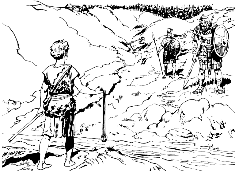
Eg-atuwan i Dabid sa mangkag etaw si Gulayat

pinengadanan da ma menuwa Épelat diyà tanà Huda. Duen sa walu anak i Hési maama, owoy tigtu dé lukes Hési i egoh i Saulo egpedatù. 13 Telu sa anak i Hési nekeunut diyà sa medoo sundalu i Saulo eg-angay eggila. Iya sa ngadan da si Iliyab sa lebi lawa di owoy si Abinadab sa keduwa di owoy si Samah sa ketelu di. 14 Nekeupà da diyà sa kenà i Saulo, enù ka eg-unut-unut da diyà sa kegila. Dodoo si Dabid sa kinohonon anak di, 15 takà egpelikùlikù eg-angay diyà sa kenà i Saulo owoy diyà sa menuwa Bétléhém kenà di eg-ipat sa medoo kebilibili sa emà di.