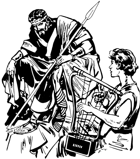
Linawag i Saulo sigpù Dabid i

8 Na, egoh i Saulo migdineg iya wé, tigtu migbulit enù ka nesina. Guwaen di, “Lagsàlagsaan gaa sa inimatayan i Dabid, dodoo ngibu-ngibuwan daa polo sa naken. Amuk hediyà, mepeka di sa kedatuan ku kani.” 9 Huenan di, edung egoh iya,