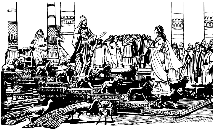
Si Solomon owoy sa booy tegeSiba

10 1 Na, egoh sa Booy tegeSiba migdineg denu sa lalag i Solomon sa pesuwan di egkeolò Datù Nemula i, mig-angay diyà kenagdi anì tukawan di sa medoo melikut igsà. 2 Agulé, nekeuma diyà Hélusalém lapeg sa medoo etaw