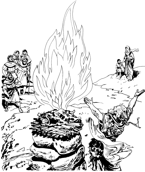
Migpetenà apuy Nemula i egoh i Iliyas migsimbà

sa lawa da. 29 Takà da egpetaled eg-umow taman sa egoh di egketeliwadaan egpenaug sa agdaw egoh di neuma dé sa atas kebegay sa medoo etaw diyà si Datù Nemula. Dodoo tapay doo endà duen sa egdinegen da egsagbi diyà kenagda owoy endà ma duen sa apuy eghauwen da.