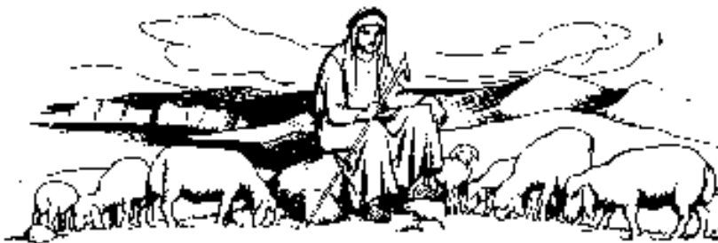
Guwaen i Hésus, “Aken sa tigtu mepion tegeipat kebilibili.” (Huan 10:11)

11“Aken sa tigtu mepion tegeipat kebilibili. Amuk sa mepion tegeipat kebilibili, maen