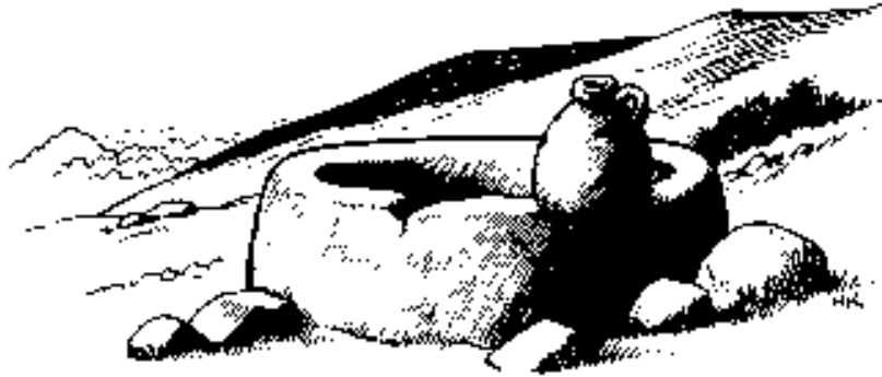
Egtebow sa bayi eg-angay wayeg diyà sa paligì. (Huwan 4:7)

egpegeni wayeg diyà keniko. Enù ka amuk egketiigan ko sa igbegay i Nemula owoy egkilalaen ko ma sa egpegeni, kuna polo sa megeni diyà kenak owoy ibegay ku diyà keniko sa wayeg egpelalù etaw.”