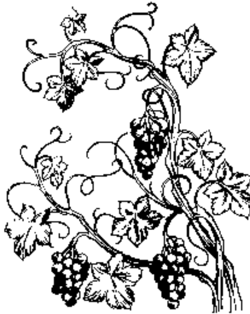
Guwaen i Hésus, “Aken lagà sa pesu keleg palas egbunga.” (Huwan 15:1)

15 1 Agulé egtulù Hésus i, guwaen di, “Aken lagà sa pesu keleg palas egbunga, owoy si Emà sa eg-ipat sa palas. 2 Amuk duen sa panga di endà egbunga, kedanan di. Owoy egtegpulen di ma sa langun panga di egbunga anì uman pa kumedoo sa bunga di. 3 Hediya ma kiyu i, enù ka migkelanìh yu