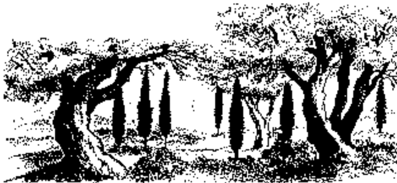
Egdalem da diyà sa hinemulaan kayu diyà sa Getan Olibu. (Huwan 18:1)

18 1Na, egoh i Hésus ubus egsimbà, eg-ipanaw da lapeg sa medoo salu di egkatin da sa wayeg Kidelon. Agulé egdalem da diyà sa hinemulaan kayu dahiya. 2Na, si Hudas sa migtampil diyà sa medoo kuntelà i Hésus, netiigan di siedò hinemulaan inangayan da enù ka iya sa kenà da i Hésus takà egkesetipon sa medoo salu di. 3Huenan di, iya ma sa inangayan i Hudas mig-uwit medoo sundalu owoy sa medoo