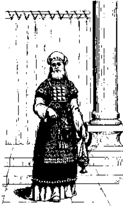
Sa Ulu-ulu Tegesimbà mig-uwit sa taguan apuy.

Tegesimbà. Ini sa baelan di, ikawal di sa tigtu mepion ginis sa atung egginisen sa tegesimbà, 33 owoy duen ma sa baelan di anì kumelanih diyà sa kehaa ku sa Tigtu Mapulù Bilik diyà sa simbaan yu owoy sa Dakel Kemalig kenà yu egkesetipon owoy sa atung kenà yu eg-ulow sa ibegay yu diyà kenak. Isimbà di ma anì mepeuloyon salà sa medoo tegesimbà owoy sa langun tegeslaél ma. 34 Na, pangunuti yu ini i uledin taman melugay. Segulê daa uman palay sa kebael yu iya wé anì