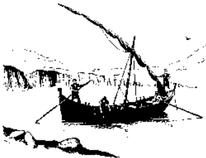
Hinaa di si Simon owoy si Andelis egpuket. (Malkos 1:16)

16 Na, egoh i Hésus eghemantad diyà sa lanaw